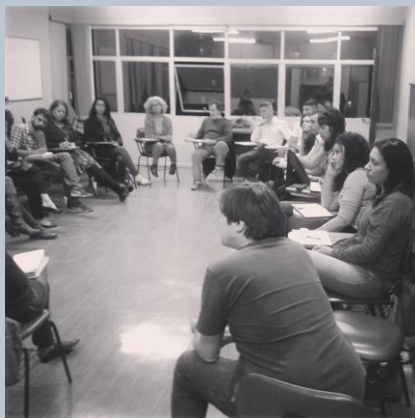
Roda de Conversa Experiências de intervenção psicossocial em contextos de violência, realizada pelo GT Violações de Direitos e Saúde Mental, em agosto.